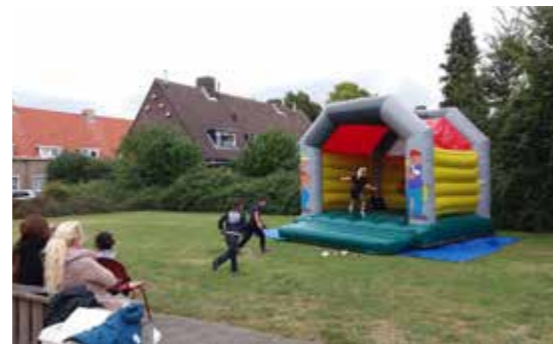
Open dag 't Huukske

Vereniging Wijkbeheer Binnenstad vierde in 2016 haar 25-jarig jubileum . Dat deed zij door het organiseren van tal van feestelijke activiteiten. Zo vond er op 9 november een kindermiddag plaats, op 16 november een feestavond voor (oud-) bestuursleden, partners en professionals en op 17 november een multiculturele bijeenkomst (Helmondo). Het jubileumjaar werd op 18 december afgesloten met een groot inloopfeest voor heel de wijk.