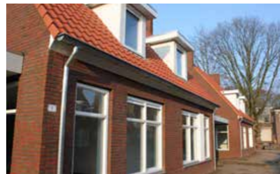
Hendrik van Ekerstraat

Begin november zijn 20 nieuwbouwwoningen opgeleverd in de Leonardusbuurt. Het gaat om 18 levensloopbestendige woningen aan de Hendrik van Ekerstraat en twee eengezinswoningen aan de Jan Stevensstraat. Voor de bouw van de woningen moest de voormalige SPOS-locatie wijken.