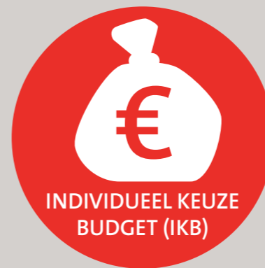
INDIVIDUEEL KEUZE BUDGET (IKB)