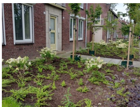
Aanpak voor- en achtertuinen

De voor- en achtertuinen aan de Hortensialaan, Anjerstraat en Broekwal zijn aangepakt. Dit om de buurt een nettere en groenere uitstraling te geven. De aanleiding hiervoor was de overlast van loslopende kippen en henen die zich schuilhielden in de verwilderde tuinen. Woonpartners startte daarom in augustus met het plaatsen van onderhoudsvriendelijke planten. Bewoners worden nu gestimuleerd om de tuinen zelf bij te houden. Ook zijn er wadi's aangelegd om regenwater op te vangen. Daarnaast zijn speciale plekken ingericht voor afvalcontainers, netjes achter een hek, zodat het straatbeeld opgeruimd blijft.