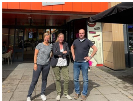
Winkelcentrum De Bus