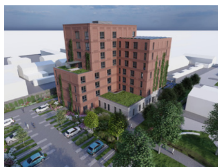
Huize d'n Herd'

In het voorjaar van 2024 is de locatie van de nieuwe daklozenopvang 'Huize d'n Herd' opgeleverd. Het aantal opvangplekken is uitgebreid. In totaal kunnen er in het nieuwe gebouw 73 mensen worden opgevangen. Het pand biedt meer privacy en veiligheid voor de cliënten en medewerkers. De gemeente heeft in het najaar van 2024 het plantsoen Binderseind heringericht. De looproute naar de passantenopvang is kort en overzichtelijk geworden, met minder overlast voor de omwonenden tot gevolg.