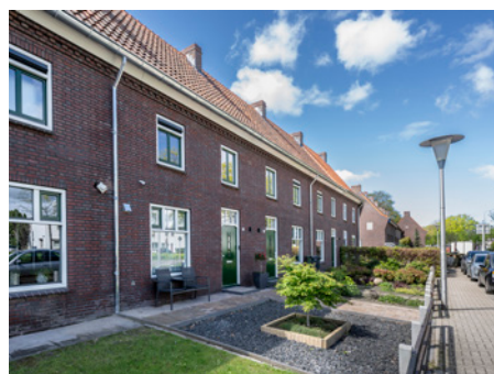
Buitenrenovatie fase 3 Leonardusbuurt

De buitenrenovatie van fase 3 is in 2024 afgerond. De buitenkant van de woningen is volledig opgeknapt. Ondanks dat de meeste woningen tijdens de werkzaamheden bewoond waren, is de overlast zoveel mogelijk beperkt gebleven dankzij de inzet van aannemer Jansen Huybrechts en Volksbelang. De verbeterde isolatie van de woningen zal onder andere bijdragen aan lagere stookkosten in de winter. De reacties van de bewoners zijn overwegend positief.