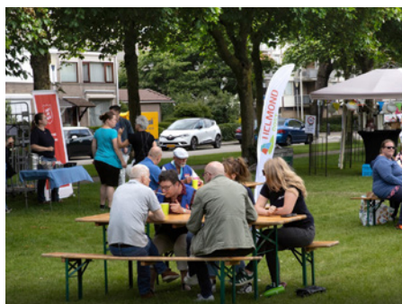
Week van Helmond Oost

De Week van Helmond Oost werd georganiseerd om de onderlinge betrokkenheid in de gelijknamige wijk te versterken. (Vrijwilligers) organisaties en andere lokale clubs presenteerden zich en boden activiteiten aan voor jong en oud, zoals een stormbaan voor kinderen, een informatiemarkt en een Groet- en Ontmoetplein met gezellige activiteiten. Professionals voerden 170 gesprekken met bewoners over hun ervaringen in de wijk en hun wensen voor de toekomst. In september besprak de werkgroep 'Zorg voor Elkaar' met partners of de week jaarlijks moet terugkeren en welke verbeteringen mogelijk zijn. Binnenkort wordt hierover een besluit genomen.