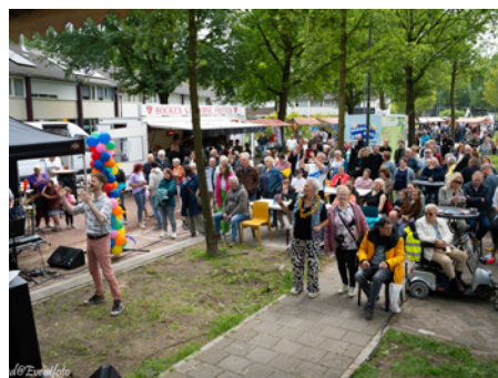
Braderie Wijkcentrum De Boerderij