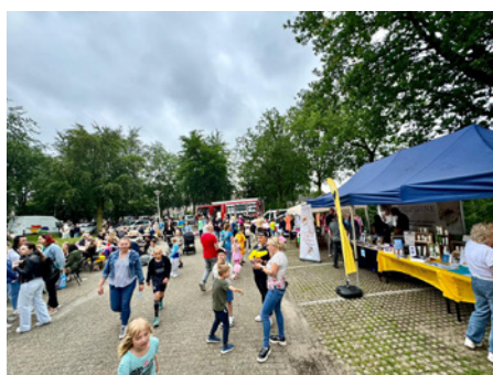
Dag van het kind

Het was druk op 1 juni bij Wijkhuis De Brem. Op die dag wordt in Polen 'De Dag van het Kind' gevierd. Daarom vond LEVgroep het een goed idee om het ook hier te vieren. Dit omdat er in Rijpelberg veel mensen met de Poolse nationaliteit wonen.