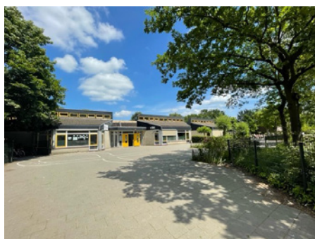
Locatie aan de Baroniehof

De locatiekeuze voor de nieuwe MFA in Rijpelberg is gevallen op de locatie aan het Baroniehof. In opdracht van de gemeente zijn er verschillende plekken in de wijk onderzocht. De plek die nu gekozen is, is groot, rustig, veilig, zichtbaar en goed bereikbaar.