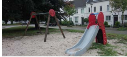
19 Binnenvoort kleine speelplek

Herinrichten en omvormen speelplekken Speelplekken 16 en 19 worden samen opgepakt. Plek 16 wordt opgeknapt en heringericht als speelplek voor de buurt. Mogelijk wordt de locatie uitgebreid met een sportfunctie. Op locatie 19 komen de toestellen niet meer terug. De speelplek zal worden ingericht met natuurlijke speelaanleidingen.