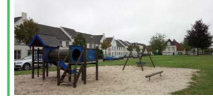
16 Moerdonksvoort buurtspeelplek

Herinrichten en omvormen speelplekken Speelplekken 16 en 19 worden samen opgepakt. Plek 16 wordt opgeknapt en heringericht als speelplek voor de buurt. Mogelijk wordt de locatie uitgebreid met een sportfunctie. Op locatie 19 komen de toestellen niet meer terug. De speelplek zal worden ingericht met natuurlijke speelaanleidingen.