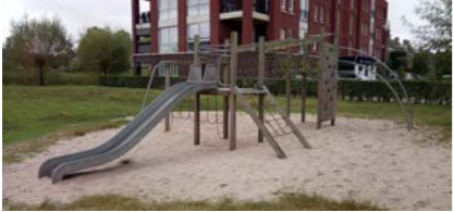
10 Brandevoortsedreef kleine speelplek

Omvormen speelplek Op de locatie 10 komen geen toestellen terug, deze plek zal worden omgevormd tot ravotplek.