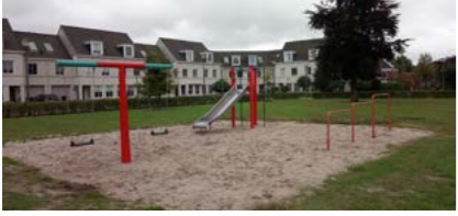
12 Bloksensersf buurtspeelplek

Herinrichten speelplek Plek 12 wordt opnieuw ingericht als speelplek voor de buurt, mogelijk met toevoeging van een sportfunctie.