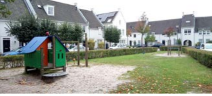
13 Briesveldje kleine speelplek

Omvormen speelplek De toestellen op plek 13 worden niet meer vervangen als deze 'op' zijn. De plek wordt daarna met natuurlijke speelaanleidingen ingericht.