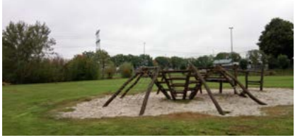
24 Zandershoeve kleine speelplek

Omvormen speelplek De speelplek 24 wordt ingericht als natuurspeelplek. De buurt wordt geïnformeerd over het (toestaan van) spelen in het groen.