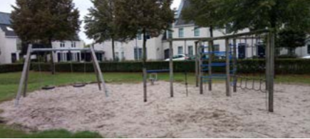
11 Karthuizererf kleine speelplek

Losse impuls natuurlijk spelen Op de korte termijn wordt het combinatie toestel bij plek 11 vervangen door natuurlijke speelaanleidingen.