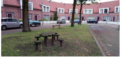
05 Brugbeemden kleine speelplek

Omvormen speelplek De ruimte op locatie 05 is beperkt. De speelplek wordt ingericht met speelaanleidingen en mogelijkheid om te ontmoeten.