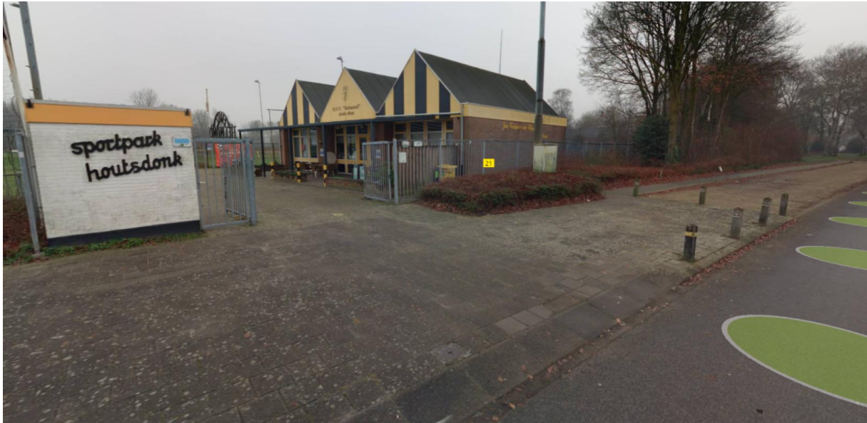
Figuur 1 Huidige situatie bij Sportpark Houtsdonk.