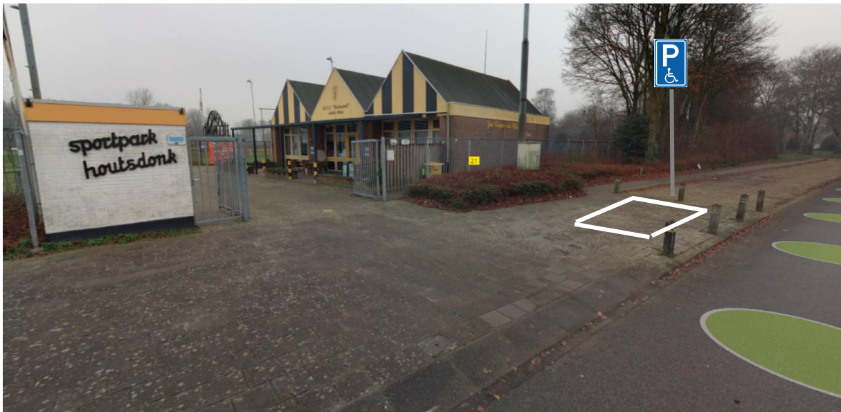
Figuur 2 Nieuwe situatie met GPP.