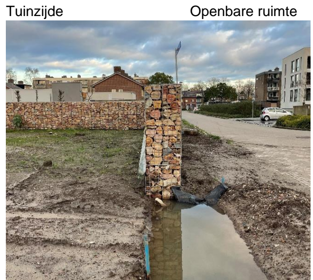
Figuur 2 Foto schanskorf Molenbunders

*Peilhoogten worden definitief bepaald bij de afgifte van de omgevingsvergunning.