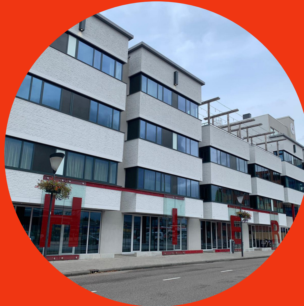
'HIER / HERE'