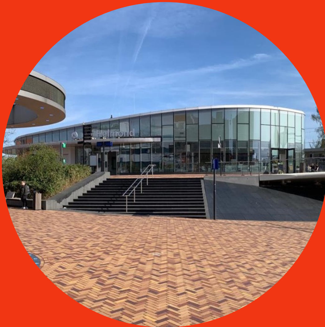
'STATION / STATIONSPLEIN'