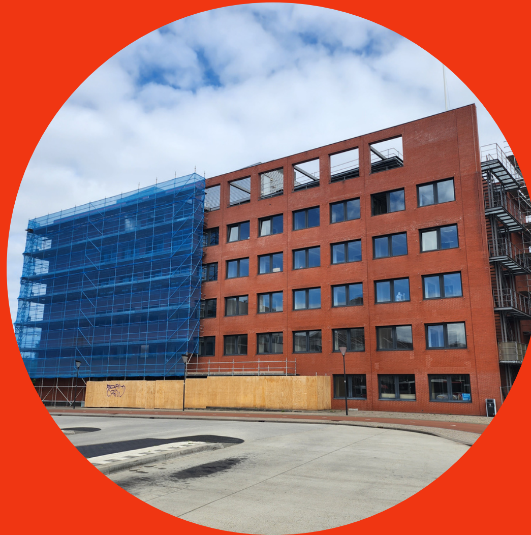
TRANSFORMATIE 'BELASTINGS- KANTOOR'