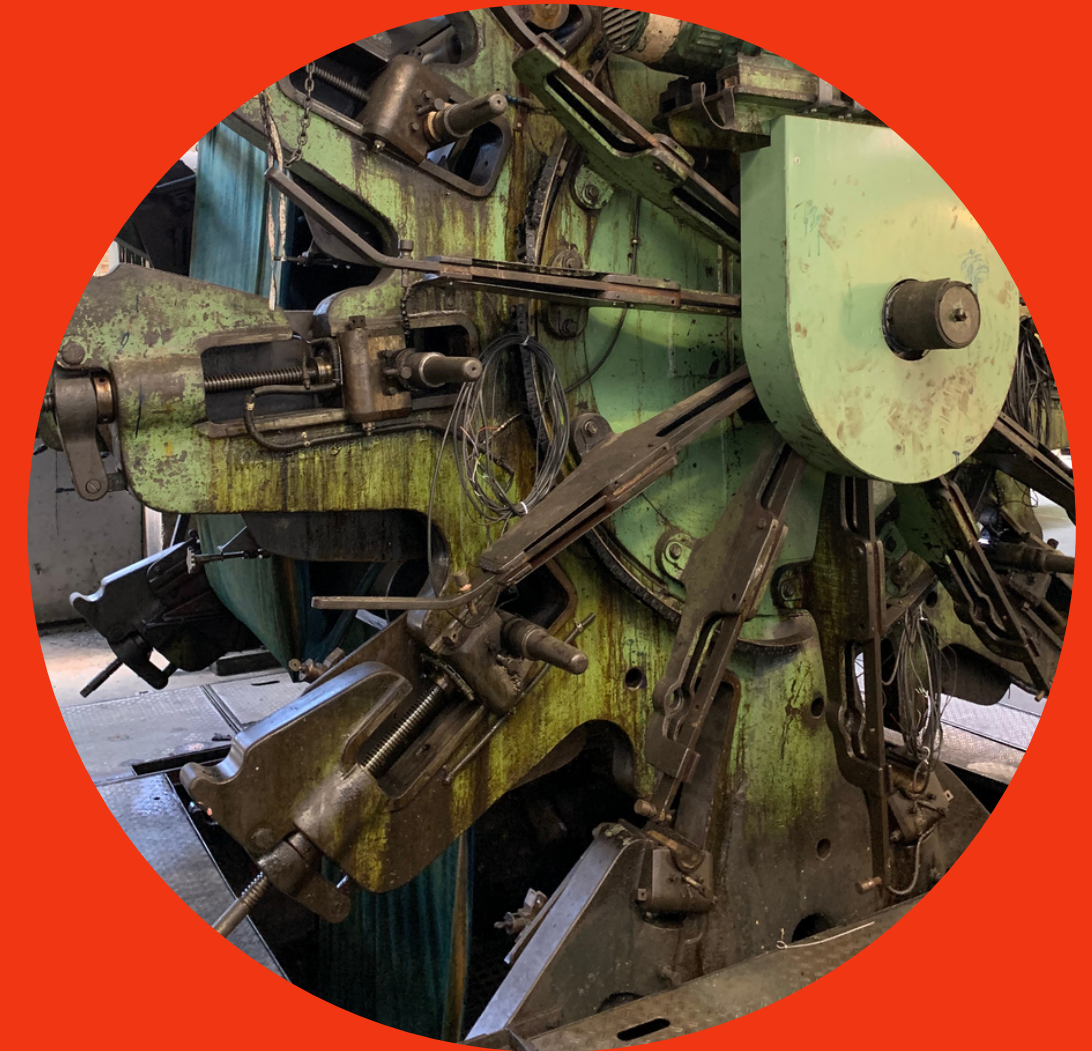
'JAVA MACHINE' VLISCO