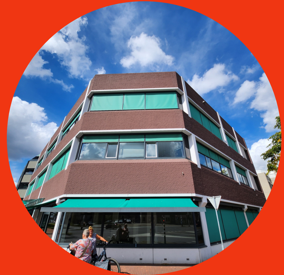
BROEDPLAATS 'DE KLUIS'