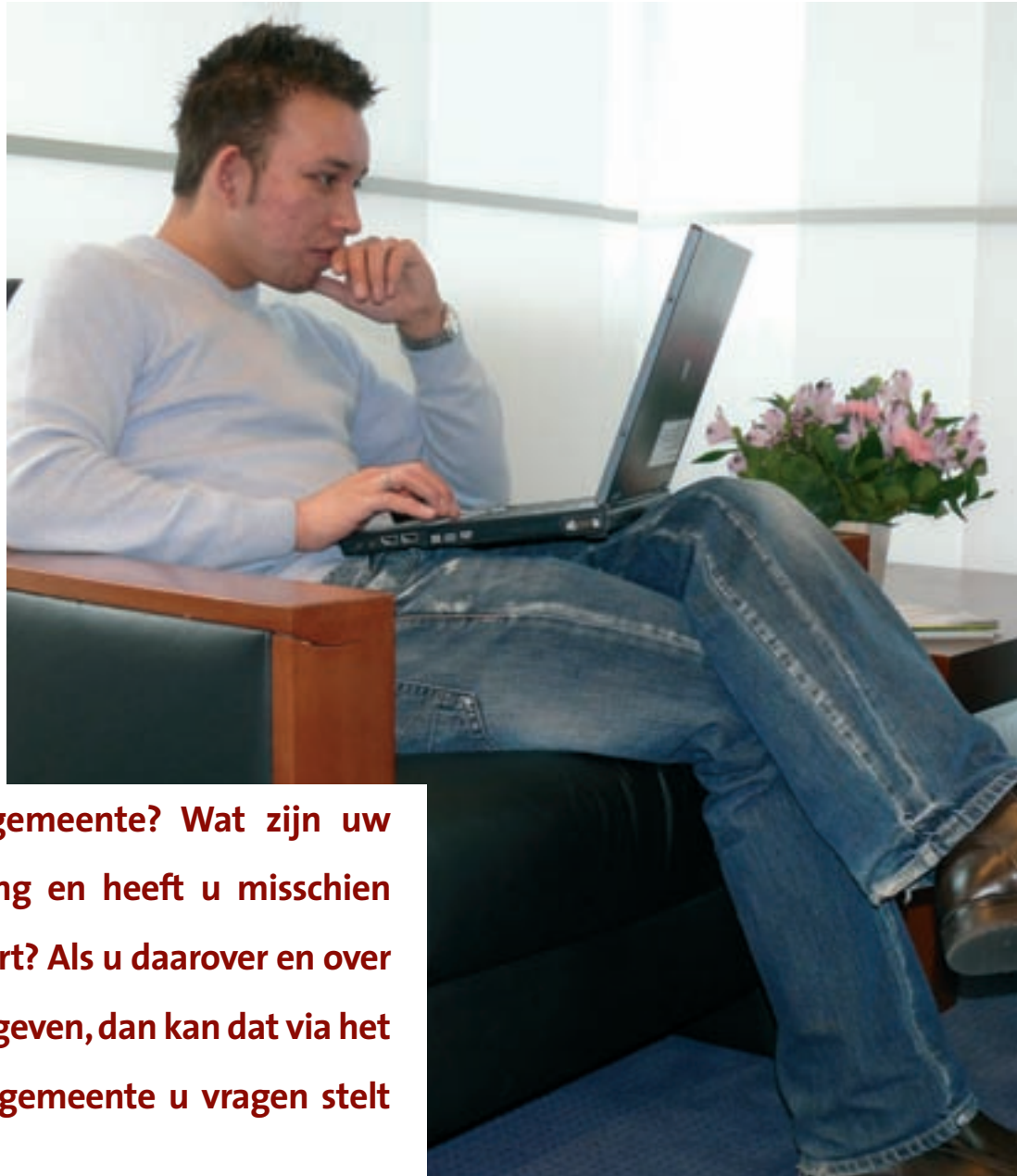
Geef uw mening vanuit uw luie stoel op helmond.nl

Wat is uw mening over het beleid van de gemeente? Wat zijn uw ervaringen met de gemeentelijke dienstverlening en heeft u misschien bepaalde wensen over de leefbaarheid in uw buurt? Als u daarover en over andere onderwerpen regelmatig uw mening wilt geven, dan kan dat via het Stadspanel. Dat is een internetpanel waarin de gemeente u vragen stelt over verschillende onderwerpen.