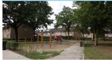
25 Buurtpark Eeuwsels buurtspeelplek