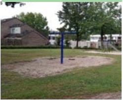
32 Marslaan kleine speelplek