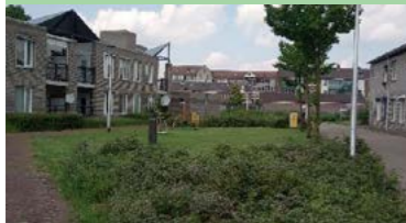
01 James Ensorlaan kleine speelplek