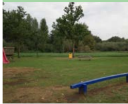
31 Sterrenlaan kleine speelplek