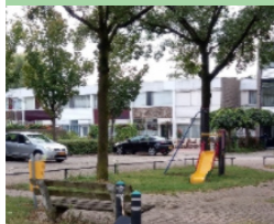
37 Adonislaan kleine speelplek