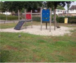
35 Astronautenlaan kleine speelplek