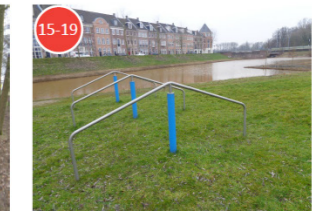
Doelgroep 15-19 jaar

Blokplek: plek ingericht voor de direct omwonenden, vaak met een beperkt aanbod en een minder openbaar karakter.