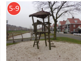
Doelgroep 5-9 jaar