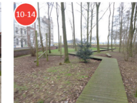
Doelgroep 10-14 jaar