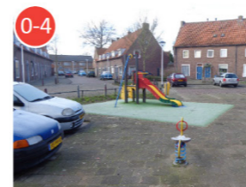
Doelgroep 0-4 jaar