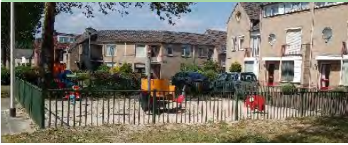
01 Klaproosplein kleine speelplek