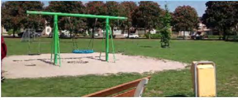
13 Sjef de Kimpepad buurt speelplek