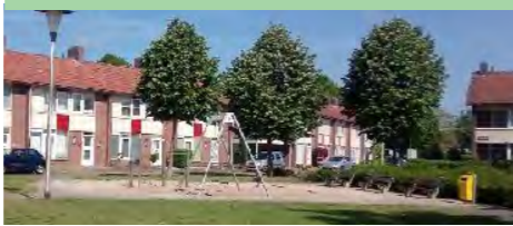
09 Admiraal de Ruyterplein kleine speelplek

Speelplek 03 in het Hortensiapark uitbreiden om de natuurlijke speelwaarde te verhogen. Mogelijk tegelijk met 01 en 02 herinrichten.