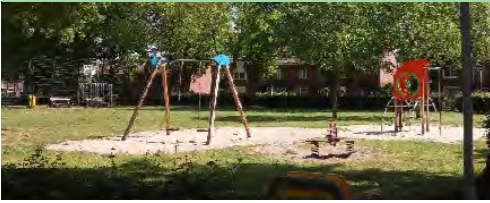
02 Bernadettestraat buurtspeelplek

De toestellen op speelplek 01 worden niet meer vervangen als deze 'op' zijn. De plek wordt daarna met natuurlijke ingrepen omgevormd tot ravotplek.