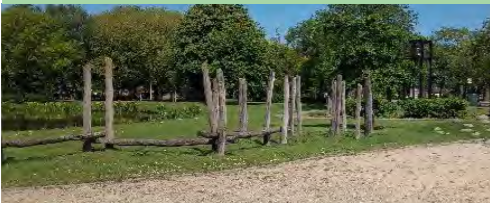
03 Hortensialaan kleine speelplek

Speelplek 02 wordt de centrale buurtspeelplek. De plek wordt in overleg met de buurt ingericht voor een brede doelgroep.