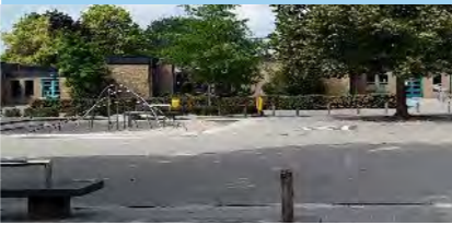
18 Icarusstraat kleine speelplek

Speelplek 13 uitbreiden tot een volwaardige centrale buurtspeelplek. Hierbij extra speelwaarde toevoegen met een speelimpuls en aandacht geven aan ontmoetings- en verblijfsfunctie.